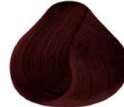
7.6 N 7R | Rubio Rojizo N Red Blond N