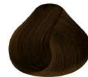
6.34 N 6Gc | Rubio Oscuro Dorado Cobrizo N Dark Golden Copper Blond N