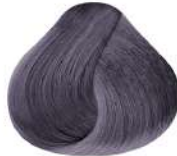
N Amatista N Amethyst N