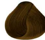
8.34 N 8Gc | Rubio Claro Dorado Cobrizo N Light Golden Copper Blond N

DOWNLOAD DIGITAL VERSION: www.nutrapel.com/colorchart/uhdcp/