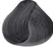
N Titanio N Titanium N