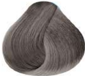
N Iridio N Iridium N

• If the hair is not 100% gray and decides not bleaching the hair without gray, the result will not be uniform. The result on this hair will be just a reflect of the selected Metallic color.