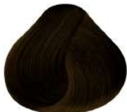
N 5G | Castaño Claro Dorado N Light Golden Brown N