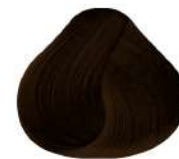
5.34 N 5Gc | Castaño Claro Dorado Cobrizo N Light Golden Copper Brown N