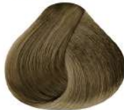
9.3 N 9G | Rubio Muy Claro Dorado N Very Light Golden Blond N