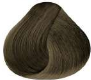
N 8G | Rubio Claro Dorado N Light Golden Blond N