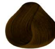
7.34 N 7Gc | Rubio Dorado Cobrizo N Golden Copper Blond N