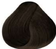
7.3 N 7G | Rubio Dorado N Golden Blond N