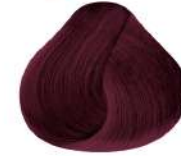
8.62 N 8Rv | Rubio Claro Rojizo Nacarado N Light Red Violet Blond N