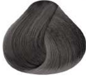
N Mercurio N Mercury N