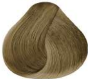
10.3 N 10G | Rubio Extra Claro Dorado N Lightest Golden Blond N