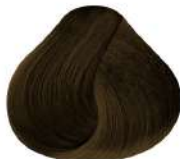
6.3 N 6G | Rubio Oscuro Dorado N Dark Golden Blond N