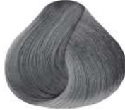
N Plata N Silver N