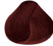
8.6 N 8R | Rubio Claro Rojizo N Light Red Blond N