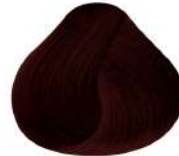
6.6 N 6R | Rubio Oscuro Rojizo N Dark Red Blond N